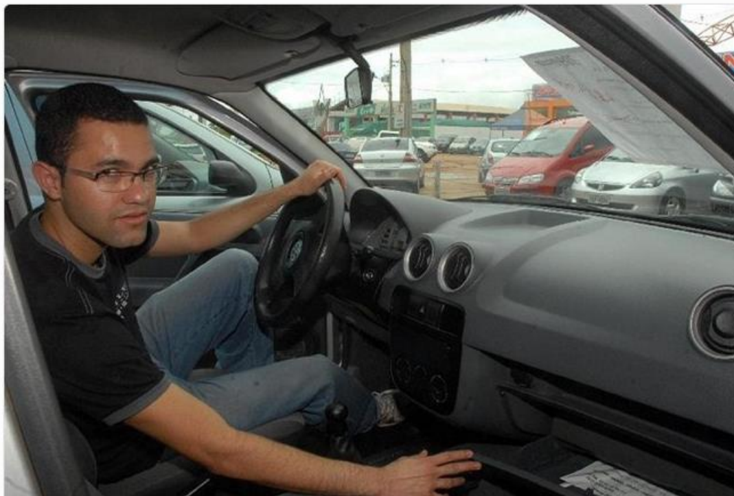
O site foi lançado em setembro, com um investimento de R$ 300 mil, e já conta com 3,2 mil concessionárias cadastradas

O site foi lançado em setembro, com um investimento de R$ 300 mil, e já conta com 3,2 mil concessionárias cadastradas em todo o País, além de 6 mil avaliações. "O ISC Digital chega para oferecer avaliações segmentadas, preenchendo a lacuna que ainda existe no Brasil, onde só é possível encontrar reviews fragmentados", afirmou o CEO da 4Life, Igor Kalassa. Nos Estados Unidos, exemplifica o executivo, há diversos portais especializados no assunto.